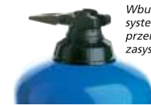
Wbudowany by-pass: system włączania (on) i przerywania (off) zasysania preparatu.

Opcje pozwalają dostosować dozownik do konkretnych potrzeb. Ich użyteczność należy określić wspólnie z naszymi służbami technicznymi.